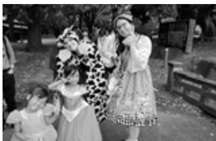
▲小学生対象「ハロウィンデー」でALT達と駅前を仮装パレード♪