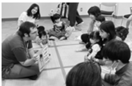
▲ALTによる英語絵本の読み聞かせ