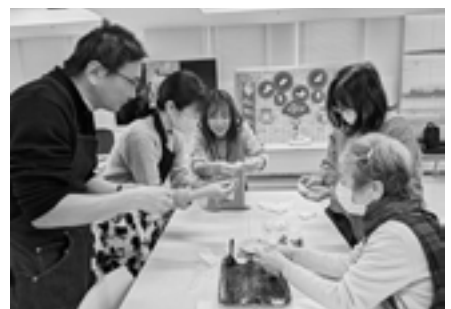
▲多文化カフェで上海ワントンづくり