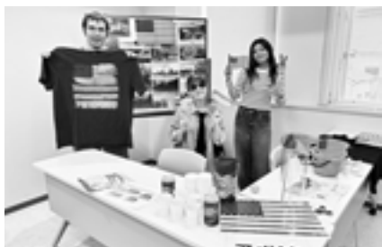
▲アメリカブース 来場者と英語でTALK!