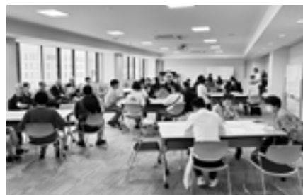
▲英語、イタリア語、タイ語、韓国語でおしゃべり交流「わいわいカフェ」