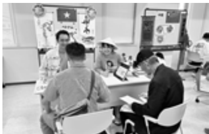
▲ベトナムブース ベトナムクイズに挑戦!

友好都市中国遼陽 りょうりやう 市人民政府のご厚意で、観光地のスタンプやパンダマグネットなどたくさんの市オリジナルグッズがまつりのために届きました。謝々（シェイシェイ）!!