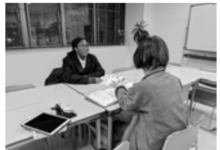
▲ロータリクラブ留学生のクラス