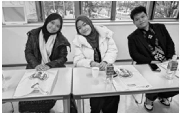
▲去る1月、市内でホームステイしたインドネシアからの大学生(国際交流サロンにて)