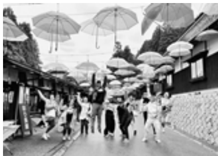
▲バスツアーはゆのくにの森へ