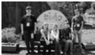
▲昨年のコロンビア市高校生たち