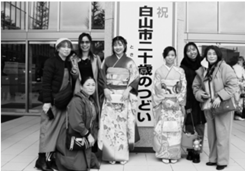
▲職場の上司や同僚たちの祝福を受けて式に出席