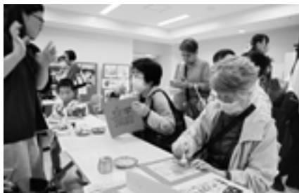
▲中国ブース 縁起のいい漢字を「拓印」