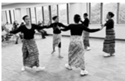
▲みんなで踊ろう! フィリピンダンス