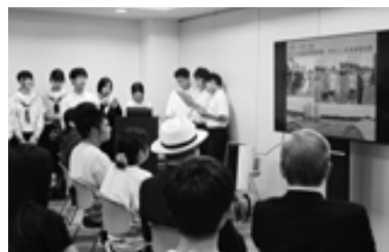
▲2025年夏に英国ボストン町訪問の中学生と豪州ペンリス市訪問の高校生による体験発表会