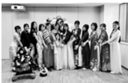
▲毎年大人気の民族衣装体験