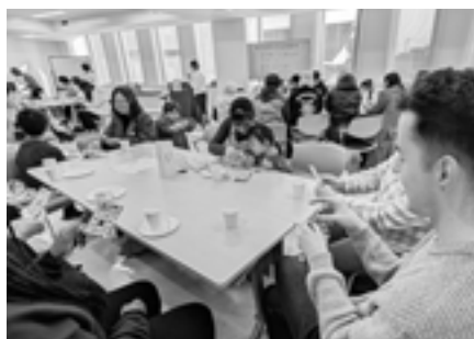
▲サロン新年交流会でビンゴゲーム