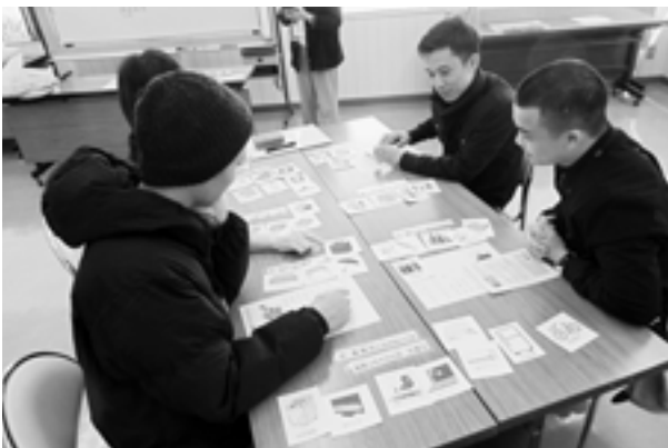
▲燃えるごみ？資源ごみ？ごみの分別をカードで学ぶ (旭丘団地協同組合事務局会議室)

旭丘団地協同組合との共催事業により、今年度、初めて開催しました。11月30日（日）、事前に申し込みのあった2社の事業所から中国、ベトナム、インドネシア出身の5名が参加しました。国際交流サロンから日本語サポーターと職員が参加し、2グループに分かれて、母国のごみ分別について会話をした後、ごみの分別の大切さについてカードを使って学びました。母国では、「ごみは分けない」、「各自で売りに行く」等とのことで、日本のルールは難しいと話していました。