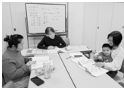
▲ベトナム人主婦たちのクラス