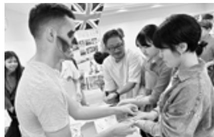
▲ハロウィンメイクやタトゥーシール体験