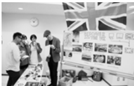
▲イギリスブース 紅茶の試飲が大人気