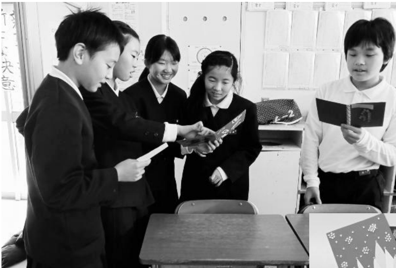
▲自分あてのグリーティングカードを受け取り、喜ぶ白山市の小学生（東明小学校にて）