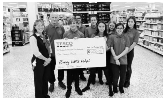
▲TESCO社員 (左端) から寄附の小切手を受け取るボストン町中学生と保護者代表 (左から2番目)

1994年の当時美川町時代からスタートしたボストン町との同プログラムは、今年がちょうど25年目にあたります。