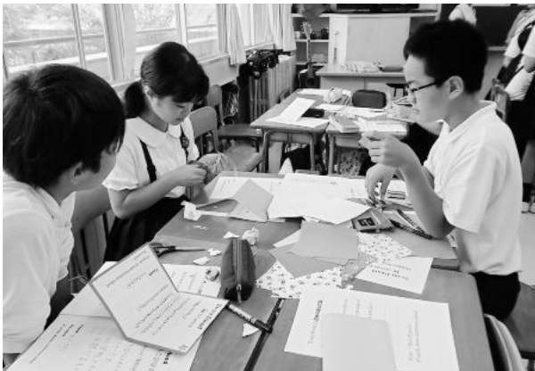
▼10月、各都市の子どもたちに宛てて、カードを作成する白山市の小学生（東明小学校にて）