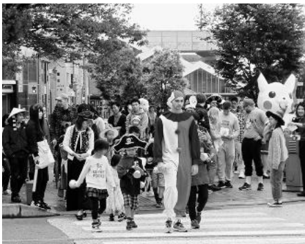
▲駅前周辺を仮装パレード

10月28日(日)、毎年恒例となったハロウィンデー、今年も国際交流サロン、松任児童館、松任図書館の3館合同で開催しました。児童館でのキャンディバック作りと図書館での英語絵本の読み聞かせの後、施設周辺を仮装パレード。その後、サロンでは、100人以上の親子が、CIRやALT、在住の外国人の皆さんとスタンラリーやピニャータなどの遊びを行いました。各国紹介ブースを回りながら世界の国の言葉でじゃんけんをしてスタンプを集めるスタンラリーでは、至るところで「ハリハリホイ！」(フィリピン語)「フントゥテイ！」(ベトナム語)など聞き慣れない言葉が飛び交い、例年以上にぎやかなハロウィンデーとなりました。