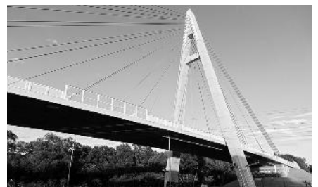
▲アウトバーンにアクセスするつり橋