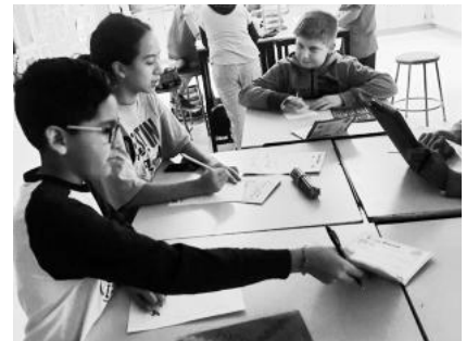
▲白山市からのカードを受け取り、返信のカードを作成する米国コロンビア市の小学生