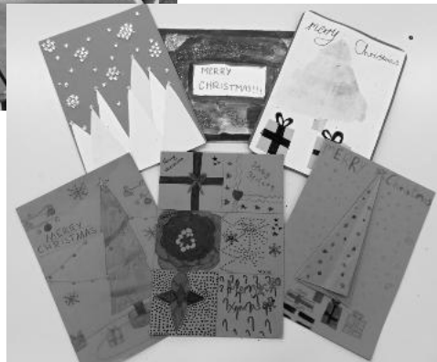
◀海外から届いたグリーティングカード

親善友好都市交流の一環として、白山市の小学生が、本市の親善友好都市のアメリカ、中国、イギリス、ドイツ、オーストラリアの5ヶ国5都市の小学生とクリスマスの時期を前にグリーティングカードを交換する事業を行っています。