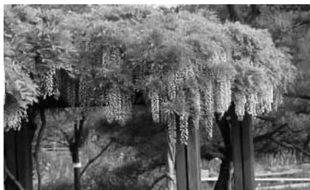
▲蓮花寺池公園の藤の花（市の花）

藤枝市とは両市災害時応援協定が結ばれているほか、中学生どうしの生徒会活動のほか、スポーツ少年団のサッカーなどの民間交流も盛んです。