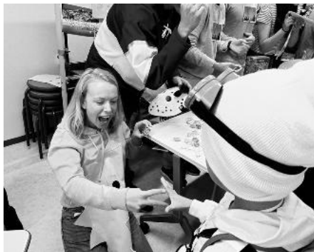
▲世界の国の言葉でじゃんけんするスタンラリー