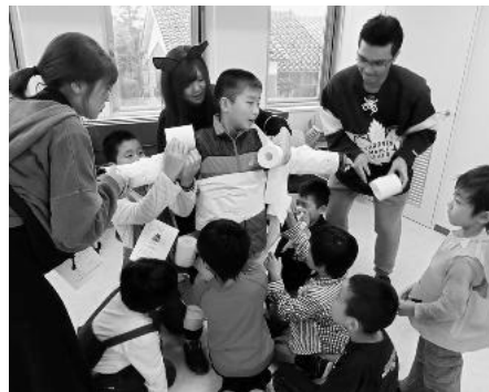
▲トイレットペーパーで体をぐるぐる巻きにし、1番怖いミイラを競うミイラゲーム