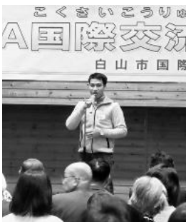
▲ベトナム人実習生による日本語スピーチ