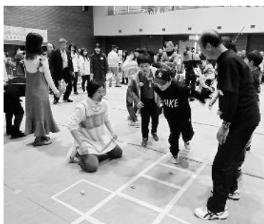
▲メキシコブースのメキシコビンゴ(左)とマレーシアブースのプレインジャンプ(右)など、日本を含む11のブースが並びました。