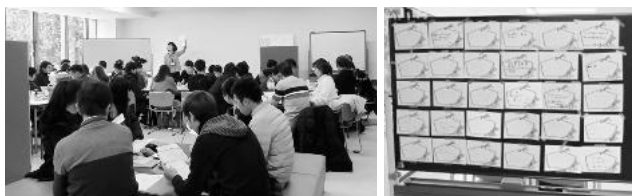
◀ 絵馬には「日本語が上手になりたい」「身体健康」「家族に会いたい」など素敵な夢や目標が書かれました。

金曜日のカフェには、国際結婚をした奥様たちが集まっています。毎回、美味しい手作りケーキの差し入れがあり楽しみに来る人も多く、久しぶりの方でも参加しやすい温かい雰囲気が人気です。25日(金)には、出産後に初めて赤ちゃんを連れて参加した中国人ママさんも。先輩ママさん達とお話をして、少しでもリラックスできていたらいいなと思います。