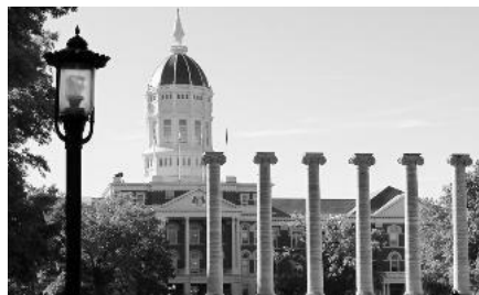
▲ミズーリ州立大学コロンビア校

コロンビア市は、ミズーリ州中北部の交通の要衝地で、東のセントルイス、西のカンザスシティからそれぞれ200kmに位置しています。市内にミズーリ州立大学コロンビア校、スティーブンス大学、コロンビア大学の3大学を有する緑豊かな学園都市です。市内の金城短期大学（当時）とコロンビアカレッジが昭和61年に姉妹校の提携を行ったことが縁で、交流が開始しました。