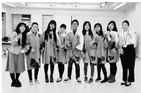
▲サロンで勉強する日本語学習者の皆さんが東京盆踊りでフィナーレ(写真は、本番前の練習にて)