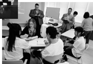
▲キャンパスライフ紹介