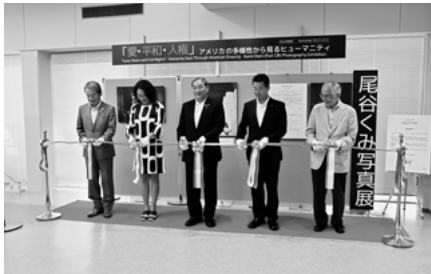
▲オープニングセレモニー