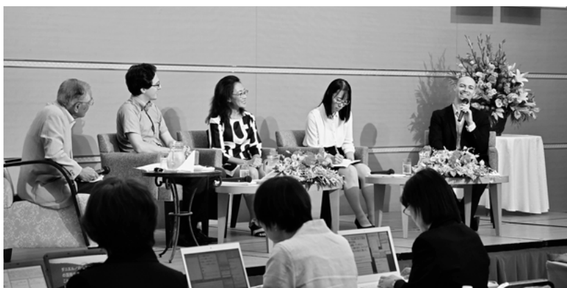
▲県内の国際交流員らによるディスカッションの様子