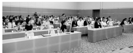
▲参加者からの質問