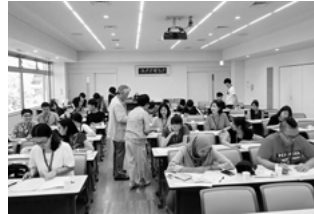
▲日本語で俳句づくり

JAL財団が主催する国際交流事業で来日したアジア・オセアニア地域の大学生25名が本市を訪れました。1日目は市俳句協会の方々から俳句の作り方を学び、2日目は13家庭による“ホームビジット”で日中の交流。3日目は今年のテーマであるSDGsにも関連する白山手取川ジオパークを巡り、国際高専の白山麓キャンパスを見学しました。