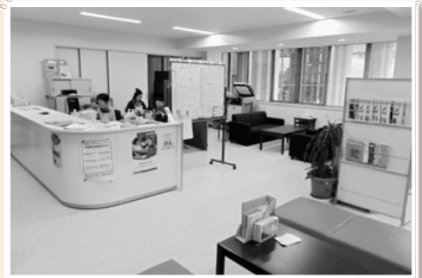
▲事務所風景。時折、窓から車両所に向かう新幹線が見えるよ！