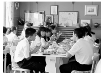
◀本場のアフタヌーンティーに舌鼓！