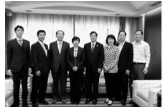
▲溧陽市政府関係者と白山市訪問団(左から3名の皆さん)