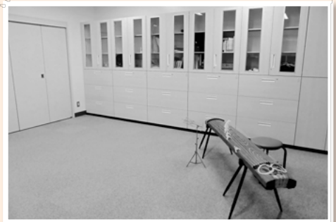
▲多目的室として、和のコーナーができました！畳マットを敷くこともでき、日本文化を体験しやすくなりました。現在、お箏のレッスンを月に1回行っています。