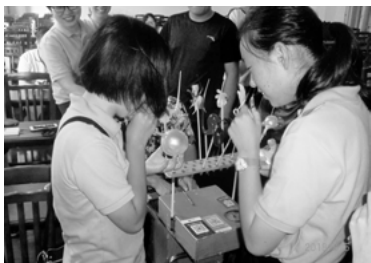
◀◀「書道」「飴細工」「茶道具作り」に挑戦し、中国の文化を堪能しました。