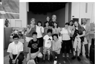
▲ホスト家庭の皆さんと