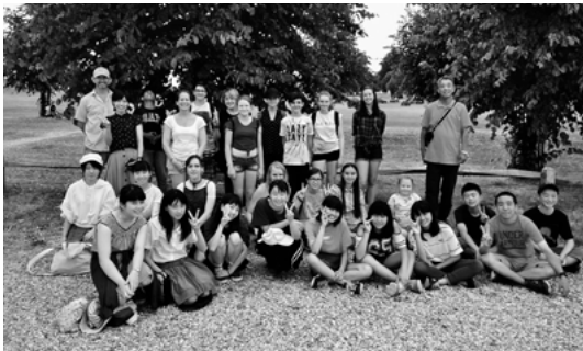
▲両中学生の集合写真

市内中学生12名と引率者3名の一行が、7月17日から29日にかけて英国・ボストン町を訪問しました。現地では、ホームステイや学校訪問、市内視察等を通して、現地の方との交流を楽しみました。