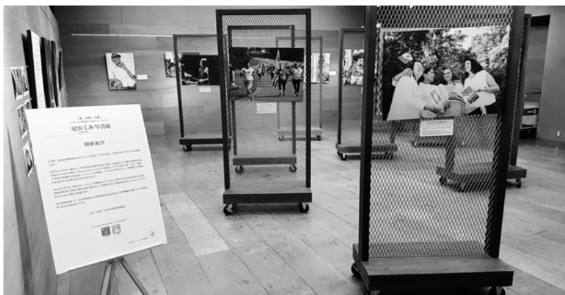
▼美川駅37カフェにおける巡回展示の様子