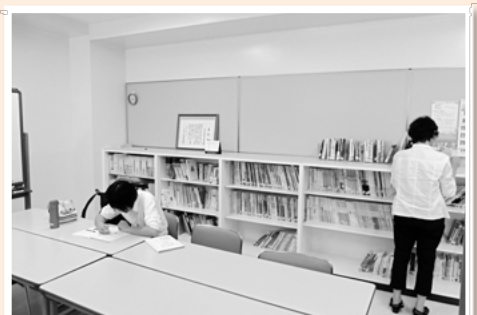
▲自習コーナーが充実しました！日本語に関する教材がたくさんある本棚も。ここで日本語の授業案を考えたり、自習をしたりできますよ。