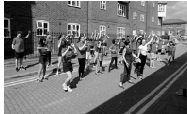
▲歌とダンスのワークショップでは、パートナーと一緒に体を動かし、ぐっと距離が縮まりました。