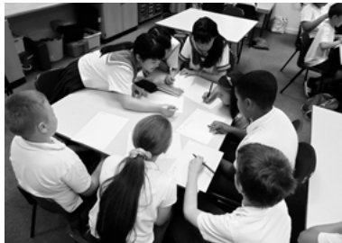
▲タワーロード小学校では、白山市の生徒が子どもたちに折り紙や日本語を紹介しました。