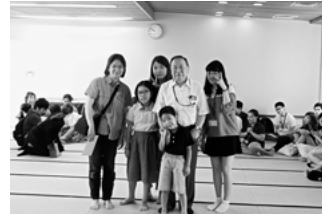
▲ホームビジット体験