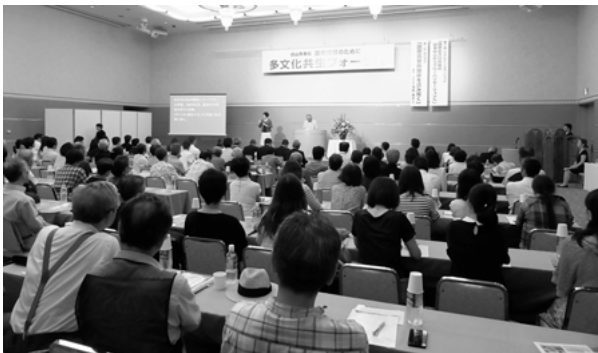
▼満席となった多文化共生フォーラム

国際交流サロンが松任文化会館のカルチャー棟2階にリニューアルオープンしたことを記念し、国籍や民族の違いを超えて地域でともに暮らす『多文化共生』に関する写真展とフォーラムを開催しました。