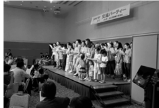
▲交流パーティーの様子