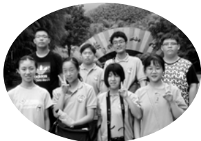
◀両市生徒の集合写真