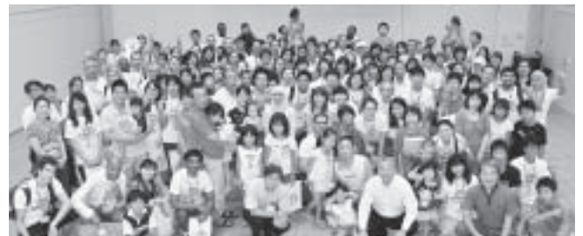
▲集合写真（留学生、ホスト家庭、市関係者）

第25回JAPAN TENTプログラムが開催され、本市には、30カ国56名の留学生が訪れ、41のホスト家庭が受け入れを行いました。24日の白山プログラムでは、午前中に俳句ワークショップ、午後からキンボール大会を実施し、留学生達は、頭と体の両方を駆使し大いに楽しみました。