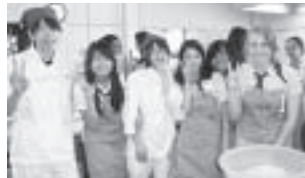
▲翠星高校でのうどん作り体験。自分で作ったうどんはとても美味しくかったようで、すぐに完食しました。