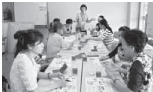
わいわいカフェでは自由な雰囲気での発話を促します。

「わいわいカフェ」は、毎月第三日曜日と最終金曜日に実施しています。同クラスを手伝ってくださる日本語サポーターを随時募集しています。