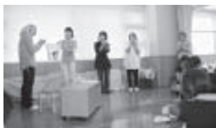
ALTや外国人市民の協力もあります。