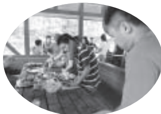
参加者全員で下ごしらえ