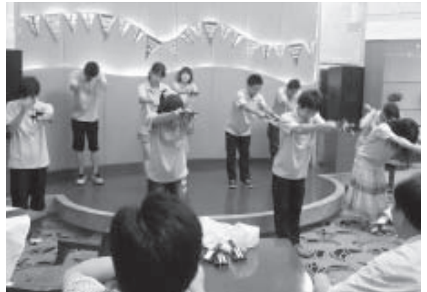
▲さよならパーティーでよさこいを披露し、拍手喝采を浴びました。溧陽市の出席者の方々も参加し一緒に踊るなど、会場は大盛況となりました。最後はお互いのユニフォームにメッセージを書き合いました。