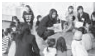
▲保育園児たちに英語でオーストラリアの動物の名前を教えました。（石川保育園にて）

オーストラリア・ペンリス市から高校生14名と引率者2名が白山市を訪れ、学校体験や日本文化体験、雪遊び体験などを行いました。また、市国際交流サロンでは、日本語教室も実施され、皆さんは熱心に授業に取り組んでいました。受入期間中、一行の来市に合わせたかのように桜が満開になり、良い天候にも恵まれ、とても有意義で楽しい交流となりました。