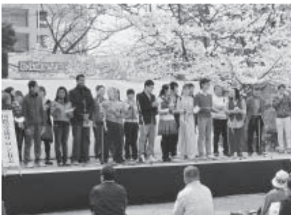
ステージイベントにも出演し、歌を披露しました。