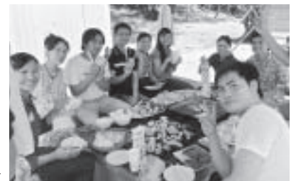
みんなで楽しくバーベキュー

9月2日(日)、CCZ松任海浜公園内にて、バーベキュー交流会を実施しました。6カ国の外国人50名と協会員30名等総勢約80名が参加し、野菜切りや火起こしをはじめ全員が協力し合って、和気あいあいと楽しみました。参加者はベトナムの春巻き、フィリピンの煮込み料理アドボなどを持ち寄り、国際色豊かなバーベキュー交流会となりました。