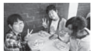
▲美味しいと評判のお店でフィッシュ&チップスをいただきました。すごいボリュームです！