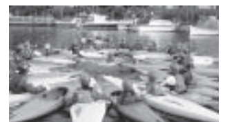
▲ウィザム川でのカヤック体験。2チームに分かれてゲーム等を楽しみました。