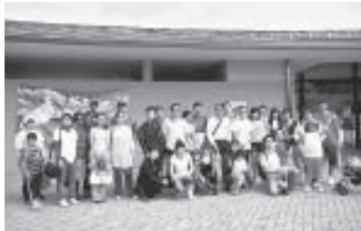
好天に恵まれ楽しいツアーとなりました。

6月3日(日)、外国人30名、部会員等4名が参加し、白山比咩神社、ふれあい昆虫館、いしかわ動物園へ出かけました。神社表参道の神秘的な雰囲気やおみくじ体験など、近くに住んでいながら、初めてのことばかり。昆虫館の「チョウの園」では、手の指にとまるチョウに大はしゃぎ。子供づれの参加者も多く、動物園でも、とても楽しんでいました。日頃出かける機会が少ない外国人も多く、地域を知る良い1日となりました。