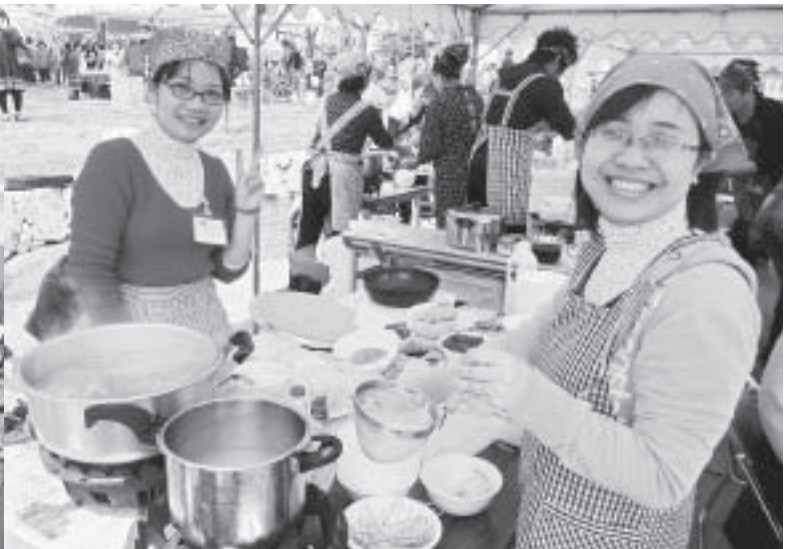
大人気の外国料理ブースでアジアの料理をふるまうベトナム人の皆さん