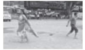
サリーを着ての全力疾走

スリランカの女性は、現在でも日常的に民族衣装であるサリーを身につけています。私も職場に通う際には身につけていますが、大きな布を足元まで巻きつけるものなので、最初は歩くのにも四苦八苦していました。私が驚いたことは、現地の女性は今年の4月に行われたアウルド・ウッサハヤと呼ばれる運動会のようなイベントで、サリーを着たままりレーにも参加していて、まさかの全力疾走。私も早く着慣れたいものだと思います。