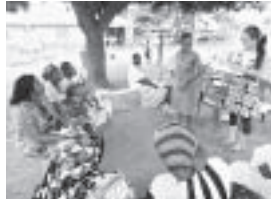
マンゴーの木の下で乳幼児健診

ガーナでは、月に1回、0～5才児を対象にした乳幼児健診が村ごとに実施されており、私もそこに同行して活動をしています。そして、それはいつも大きなマンゴーの木の下で実施されています。日本でいう集会所というような建物はなく、マンゴーの木がその役割を担っています。また、住所に「大きなマンゴーの木の近く」という風に使われていたり、マンゴーの木が果たす役割が大きいことに驚きました。