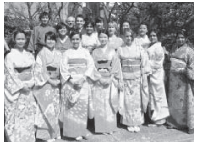
▼市民の方から協会にご提供いただいた振り袖を着て記念撮影。茶道も体験し、日本文化に触れる一日となりました。