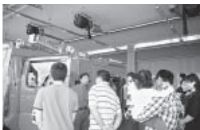
松任消防署を見学し、緊急時の対応を学習

日本語学習の課外活動として、6月17日(日)、外国人とその家族20名、日本語サポーター7名が消防本部防災学習センターを見学し、地震や消火活動を体験しました。昨年の震災後、外国人の皆さんの、防災への意識は高く、特に地震には敏感になっています。見学後、サロンに戻り、日本語修得レベルに分かれて、感想を発表しました。「震度7は思ったほど強くなかったが突然の場合はパニックになると思う」、「救急車が呼べるように住所を間違いなく言いたい」などと話していました。