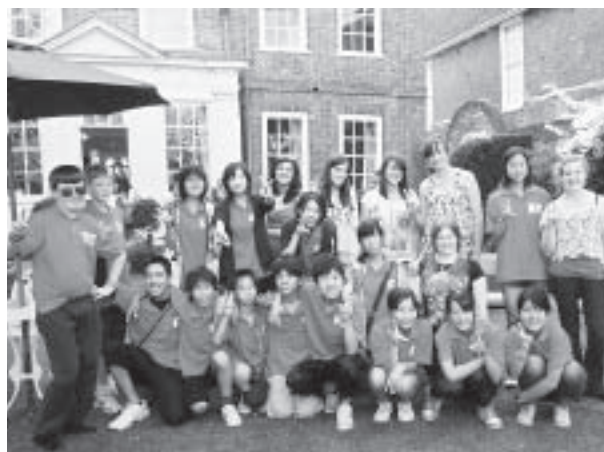
▲さよならパーティーでの集合写真。ホストファミリーだけでなく、以前この事業に参加したボストン町生徒たちも数名参加し、とても和気あいあいとした楽しいパーティーとなりました。

本市の中学生13名と引率者3名がイギリス・ボストン町を訪問し、11日間のホームステイ体験や学校体験、カヤック体験、アーチェリー体験等を通して、ボストン町の方々と交流を行いました。夕方からの活動もたくさんあり、ホスト家族も加わって一緒に活動を楽しみました。受け入れに関わったボストン町の方々は大変親切で、白山市生徒たちは誰一人ホームシックにかかることなく楽しく過ごすことができました。生徒たちにとって初体験の活動も多く、とても良い思い出がたくさんできました。