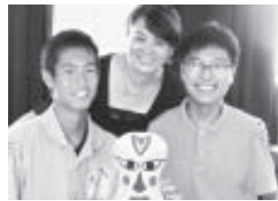
▲第二中学校での交流でお面作りを体験。個性豊かなお面がたくさん出来ました。

本市の中高生10名と引率者3名が中国・溧陽市を訪問し、3日間のホームステイ体験や学校訪問、太極拳や書道交流などを通して、溧陽市の方々と交流を行いました。あつという間のホームステイでしたが、生徒たちは英語やジェスチャーでコミュニケーションを図り、ホスト家庭と楽しい時を過ごすことが出来ました。今回の訪問で、中国の印象が変わったという生徒が多く、とても有意義な交流となりました。