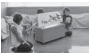
読み聞かせをするABCの会の皆さん

絵本の持ち方、見せ方、読み方、そして絵本選びに至るまで、メンバーの皆さんは子供達のあどけない眼差しを励みに日々勉強中です。ALTや外国人市民の皆さんにも協力をいただきながら、一緒に作り上げています。毎月第2土曜日の11:00~11:30、松任図書館2階おはなしルームにて行っています。予約不要ですので、お気軽にのぞいてみてください。また、ABCの会にご協力いただける方も大歓迎です。