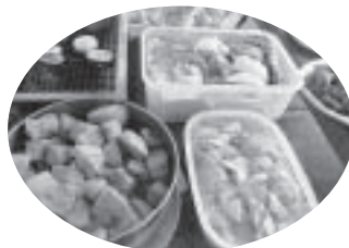
お国の料理を持参