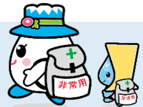
白山手取川ジオパーク イメージキャラクター ゆきママとしずくちゃん

災害が発生、又は発生するおそれがある場合にその危険から緊急的に逃れるための避難場所です。