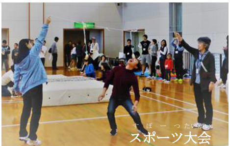
すぽーつたいかい スポーツ大会